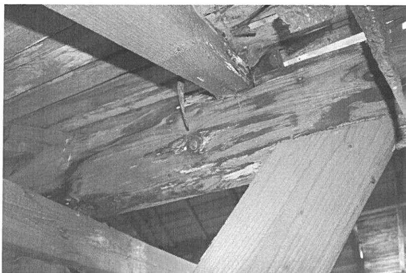
Elemente de sarpanta degradate

In vederea stoparii acestor degradari se propun urmatoarele lucrari :